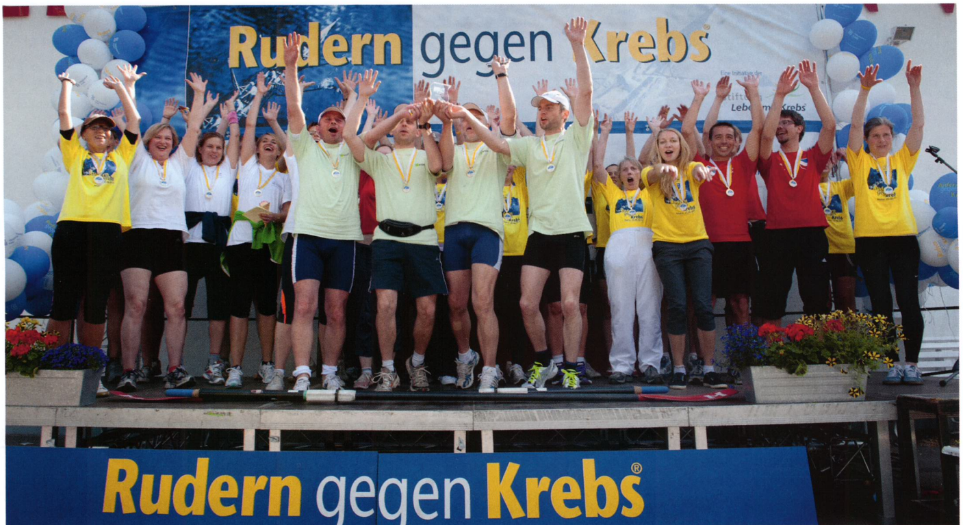
Ausgelassene Stimmung auf dem Siegerpodest – so wird es wohl auch bei der Jubiläumsveranstaltung am 21. Juni wieder sein.

10. Benefizregatta in Mainz unterstützt auch dieses Jahr Sportprogramme für Krebspatienten