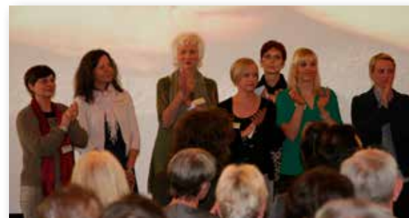
Mitarbeiterinnen bedanken sich bei ehrenamtlichen Helfern

Onkologisches Forum, Fritzenwiese 117, 29221 Celle, Tel. 05141/217766 (Mo-Fr 9-12 h und Mi 14-16 h), offene Sprechstunde (ohne Anmeldung) jeden Mittwoch von 14-16 Uhr. Mehr Infos: www.onko-forum-celle.de