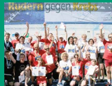
Benefizregatta Starnberg 2007