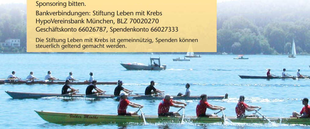
Benefizregatta Starnberg 2007

Die Einnahmen (Startgebühren, Spenden und Sponsoring) der Regatta 2007 in Starnberg wurden dem Tumorzentrum München zur Entwicklung und Durchführung eines Sportprogrammes für Krebspatienten zur Verfügung gestellt.